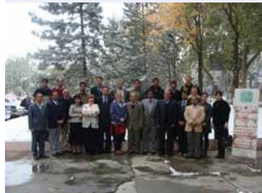
Участники ежегодного совещания, Ташкент, ноябрь 2011