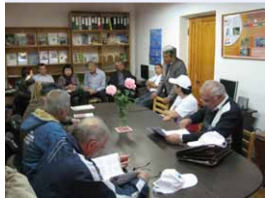
Участники посетили Региональный учебный центр по грецкому ореху

Основной целью совещания было обсуждение хода выполнения проекта в Бангладеш, Индии, Таджикистане и Узбекистане и подготовка итоговых рекомендаций для всех участников данного проекта. В ходе совещания были представлены результаты испытаний, включая результаты по основным селекционным сортам в каждой из стран-участниц, а также были рассмотрены протоколы для экспериментов в лабораториях, теплицах и на полях. Также были представлены результаты в области топографии ГИС (географической информационной системы) по регионам стран реализации проекта с