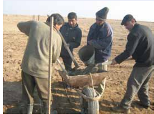
Создание семенных участков

В своей вступительной речи, д-р Махмуд Солх, Председатель программы, Генеральный директор ИКАРДА, подчеркнул, что: «За последнее десятилетие Программа КГМСХИ-ЦАК привлекла значительные финансовые средства для осуществления своих исследовательских проектов в области улучшения сельскохозяйственных культур, сохранения генетических ресурсов растений, управления природными ресурсами, а также в сфере социально-экономических исследований для сельского хозяйства в регионе ЦАК». Также, в числе других приоритетных направлений Программы, он отметил развитие потенциала и стратегические исследования. «Я хотел бы поблагодарить Правительство Узбекистана за оказанное гостеприимство и поддержку Программы с момента ее основания», сказал д-р Солх, говоря о значимости сотрудничества с партнерами НССХИ в регионе.