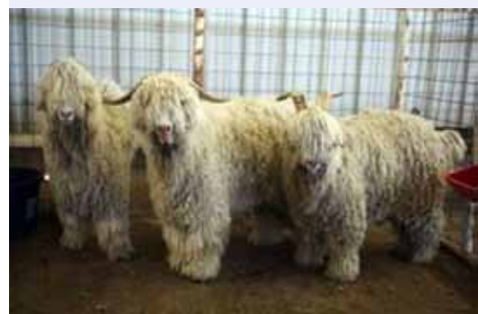
Американские нестриженные ангорские козы на выставке овец в Техасе (США), июль 2010 г.