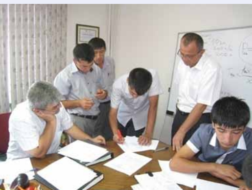
Экономическая оценка производства овощей.