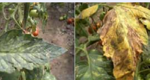
Начальная (слева) и последняя (справа) стадии бурой пятнистости томата в тепличных условиях

Во время эксперимента наилучшие результаты были получены в варианте, где обрабатывались рассада томата и почва при помощи «Байкал ЭМ1». Помимо полученного высокого урожая, в данном варианте во время роста томата каких-либо признаков болезней обнаружено не было, тогда как в контроле и других вариантах появлялись бурые пятна на листьях томата.