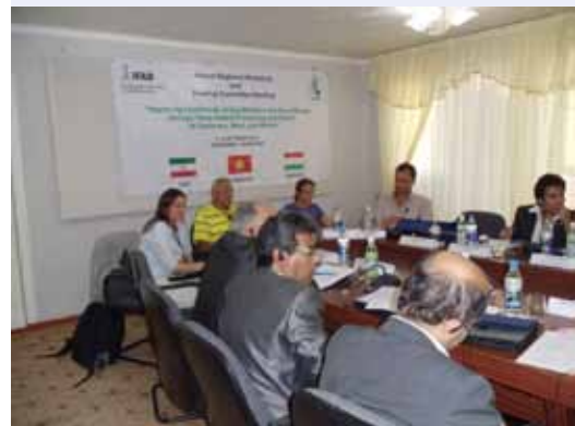
Обсуждения во время неформальной встречи