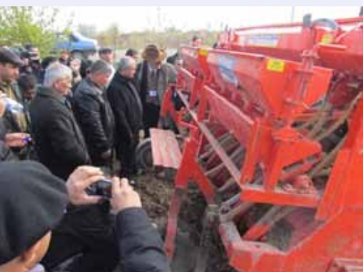
Демонстрация оборудования РСХ