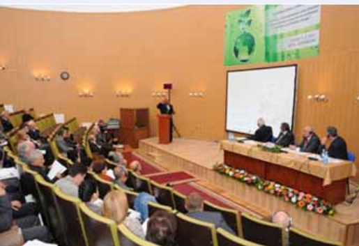
Во время работы совещания

В период с 3 по 4 октября 2011 года в г. Баку, Азербайджан была организована международная конференция на тему «Разнообразие, характеристика и использование генетических ресурсов растений для усиления устойчивости к изменению климата». На конференции, которая была организована в Институте генетических ресурсов Академии наук Азербайджана, приняли участие более 140 ученых из 12 стран и 5 международных организаций, включая Продовольственную и сельскохозяйственную организацию ООН (ФАО), Международный центр по улучшению пшеницы и кукурузы (СИММИТ), Международный центр по сельскохозяйственным исследованиям в засушливых регионах (ИКАРДА), Международного центра по сохранению биоразнообразия (Биоверсити Интернэйшнл) и Глобальный фонд по разнообразию сельскохозяйственных культур.