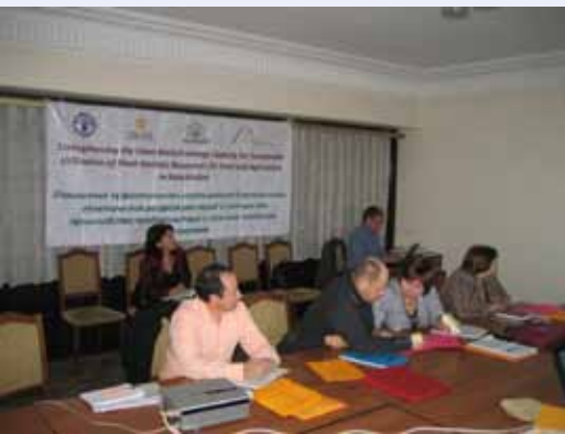
Участники семинара

В 2010 году по инициативе Правительства Республики Казахстан Национальный центр биотехнологии Министерства образования и науки (НЦБ МОН РК), АО «КазАгроИнновация» Министерства сельского хозяйства (КАИ МСХ РК) в сотрудничестве с Продовольственной и сельскохозяйственной организацией ООН (ФАО) и Международным центром улучшения пшеницы и кукурузы (СИММИТ), начали реализацию научно-технического проекта «Повышение эффективности биотехнологий для нужд селекции и генетических ресурсов растений». Основными целями данного проекта являются (1) улучшение селекции важнейших сельскохозяйственных культур на основе методов биотехнологии и эффективного использования генетических