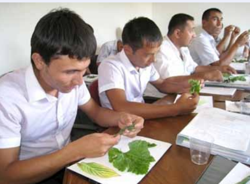
Диагностика болезней

Специалистами была представлена деятельность АЦИРО и его перспективные сорта, также представлен ряд лекций по комплексным мерам борьбы с вредителями в открытом и защищенном грунте, диагностике болезней и вредителей, экономическому анализу максимальной урожайности