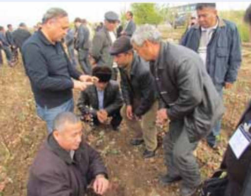
Обсуждение принципов РСХ в полевых условиях