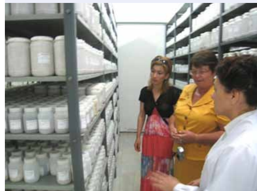
Казахские специалисты посетили генбанк УзНИИР

В настоящее время в Казахстане, финансирование научных учреждений и научно-технических программ по биотехнологии осуществляется через Министерство образования и науки, а финансирование селекционных программ, в основном, осуществляется Министерством сельского хозяйства. К сожалению, в Казахстане до сих пор отсутствует четкая стратегия осуществления селекционных работ, как по пшенице, так и другим сельскохозяйственным культурам. До сих пор не разработана и не принята Национальная Стратегия использования генетических ресурсов растений для продовольствия и сельского хозяйства. В связи с этим, как отметили участники семинара, подавляющее большинство научных учреждений по биотехнологии растений и селекции сельскохозяйственных культур в настоящее время работают без тесного взаимодействия. Основными причинами являются ведомственная разобщенность по этим взаимосвязанным направлениям науки, слабо координируемая система финансирования из различных источников и программ. В связи с этим, участниками семинара была отмечена необходимость разработки и внедрения национальных стратегий по селекции и использованию