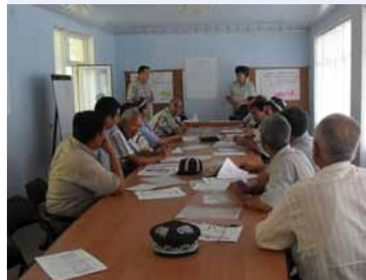
Подведение итогов консультаций

У мелких производителей овец, пуховых и ангорских коз в Таджикистане, Кыргызстане и Иране есть общая проблема – ограниченный доступ к мировым рынкам шерсти, что значительно снижает уровень их дохода. Данное ограничение негативно сказывается также и на сообществах местных прядильщиц, которые повышают стоимость волокна путем обработки и в большинстве случаев, состоят из малоимущих сельских женщин. В дополнение к неразвитым связям с рынками сбыта, производители пуха, мохера и шерсти испытывают недостаток научной, организационной и технической поддержки для улучшения животноводства и качества производимой шерсти. В странах Центральной Азии, таких как Кыргызстан и Таджикистан, централизованные государственные программы по селекции, поддерживавшие производство овец и коз, перестали существовать после распада Советского Союза, и не были заменены даже менее масштабными селекционными программами для частных производителей. Указанные факторы не только оказывают влияние на качество производимой шерсти, но и делают данный сектор неконкурентоспособным в долгосрочной перспективе, что в свою очередь, ставит под угрозу устойчивость доходов тысячи семей, зависящих от производства и обработки шерсти. Многие из этих семей живут в бедности в отдаленных агроэкологических регионах, где производство мелкого рогатого скота, такого как ангорские и пуховые козы, является единственным источником дохода.