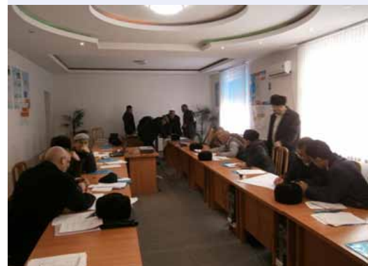
Участники в группах обсуждают варианты совместного руководства