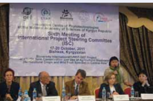
Во время работы совещания