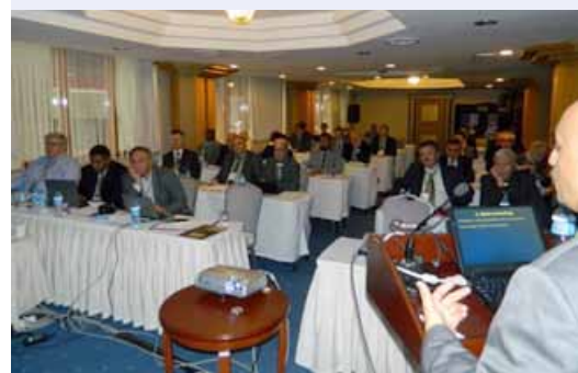
Выступления национальных представителей