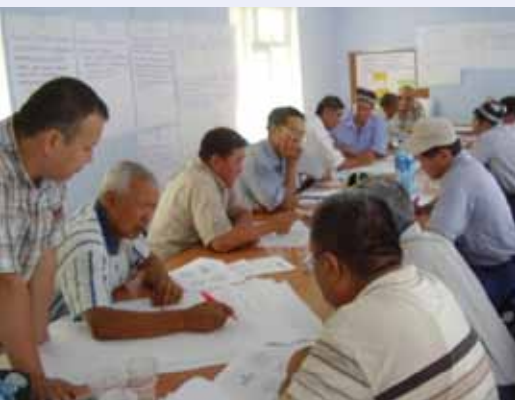
Работа в группах: проработка институциональных вариантов трансграничного управления водой.

В августе 2011 года в приграничном местечке под названием «Овчи Калача» в Бабаджангафуровском районе Согдийской области Республики Таджикистан, при посредничестве Международного института по управлению водными ресурсами в рамках проекта «Интегрированное управление водными ресурсами в Ферганской долине», прошел первый раунд двусторонних консультаций на низовом уровне по институциональным вариантам совместного управления водными ресурсами в бассейне трансграничной реки Ходжабакиргансай. Консультации проводились на уровне членов правления Водных комитетов суб-бассейнов, ранее