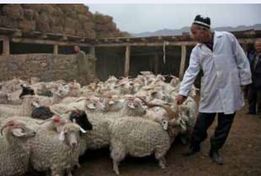
Синхронизированные козы, Аштская область (Таджикистан), октябрь 2011 г.