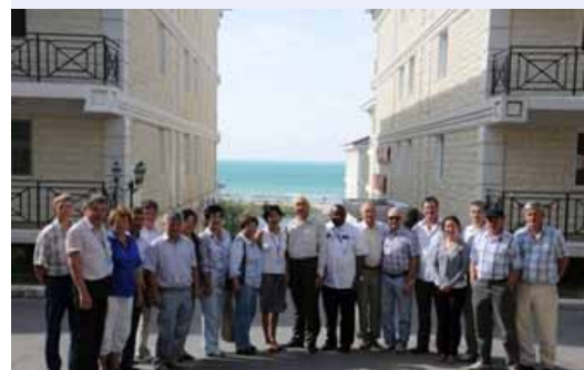
Участники учебного семинара