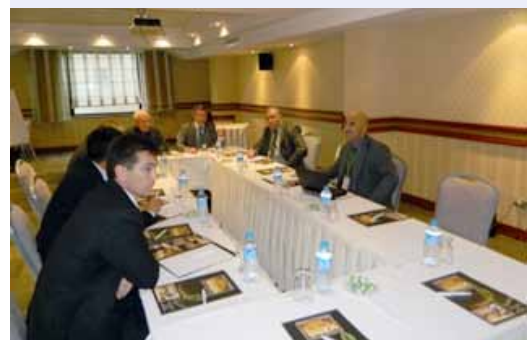
Обсуждение в рабочих группах

Восемь экспертов из Казахстана, Кыргызстана, Румынии, России,