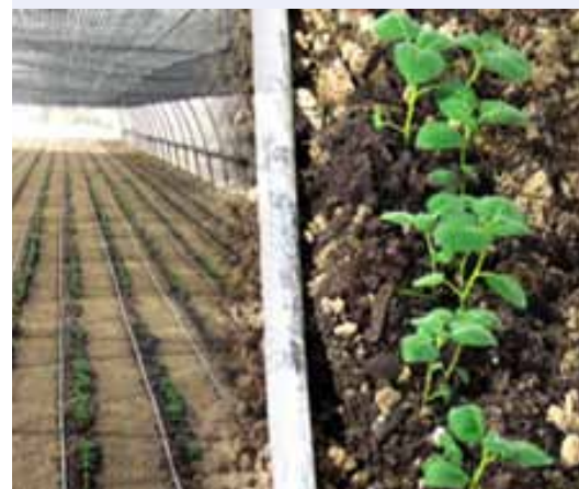
Экспериментальная теплица семенного картофеля в Национальном Университете Узбекистана

Наши партнеры признают, что эти позитивные изменения являются результатом работы СИП в регионе, сосредоточенной на ускорении процесса развития сортов в условиях нарастающих проблем изменения климата, которые