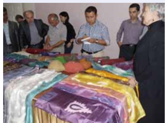
Демонстрация продукции, изготовленной на пилотных участках проекта