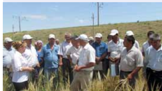
Участники Полевого Дня обсудили текущие вопросы производства пшеницы в Казахстане.