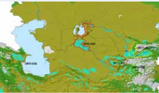
Демонстрационные участки в Центральной Азии и Южном Кавказе, выбранные в рамках программы ИПК 1.1.