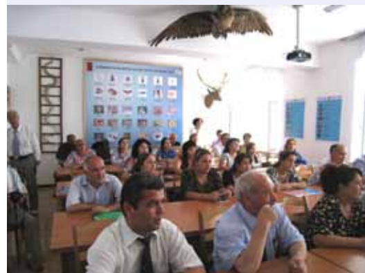
Лекция в Национальном Университете Таджикистана