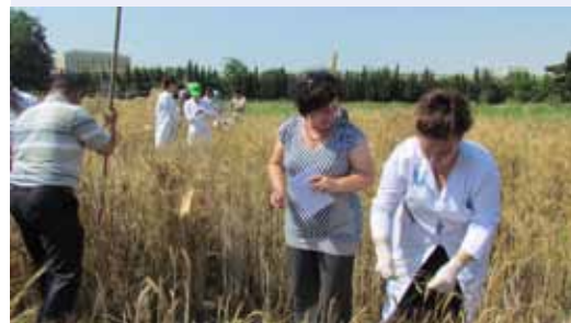
Сбор данных участниками тренинга на экспериментальных участках пшеницы