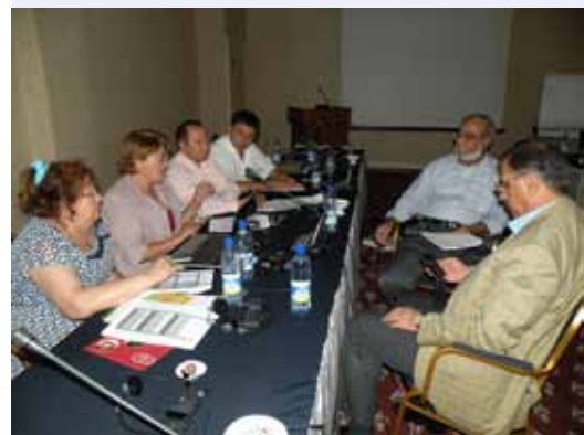
Обсуждение годового рабочего плана с казахскими партнерами