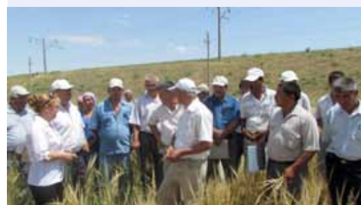
Участники Полевого Дня обсудили текущие вопросы производства пшеницы в Казахстане.