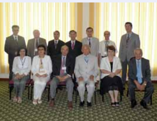
Участники региональной встречи экспертов CACAARI