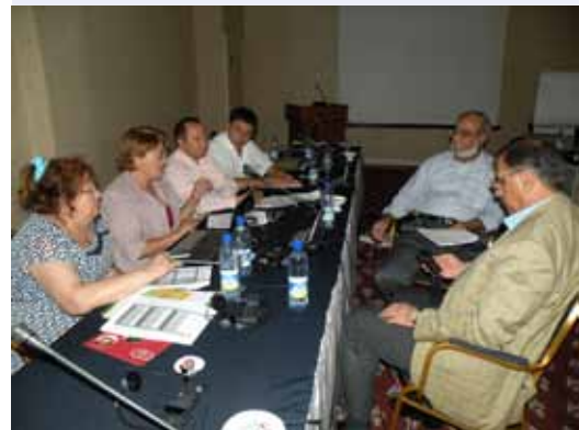
Обсуждение годового рабочего плана с казахскими партнерами