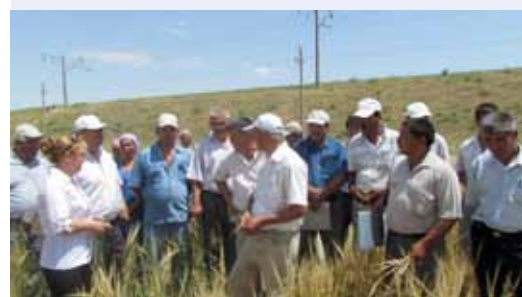
Участники Полевого Дня обсудили текущие вопросы производства пшеницы в Казахстане.