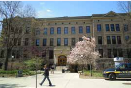
Школа природных ресурсов и охраны окружающей среды Мичиганского Университета в Анн-Арборе (США)

году в Зеравшанских горах (Таджикистан) в сотрудничестве с д-ром Аден Ав-Хасаном, директором SEPRP, Головной офис ИКАРДА, Алеппо (Сирия).