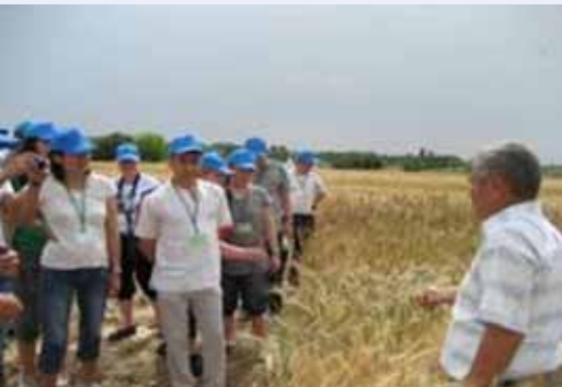
Посещение Красноводопадской сельскохозяйственной экспериментальной станции, Южный Казахстан область, 8 июня 2011 г.