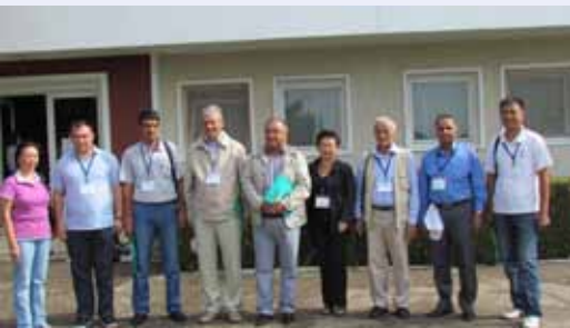
Участники выездного семинара IWWIP из региона ЦАК

Региональный семинар по «Общественной информированности» был организован в рамках проекта Bioversity International/UNEP-GEF «In situ/on farm сохранение и использование агробиоразнообразия (плодовые культуры и их дикие сородичи) в Центральной Азии» с 6 по 8 июня 2011 года в г.Ташкенте, Узбекистан. В семинаре приняли участие 15 представителей ключевых партнеров проекта из Казахстана, Кыргызстана, Таджикистана, Туркменистана и Узбекистана. Приглашенным инструктором на тренинг-семинаре выступил г-н