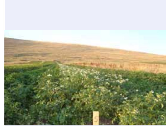
Ахалкалаки, Грузия: клоны СИП в конце Августа 2010г.