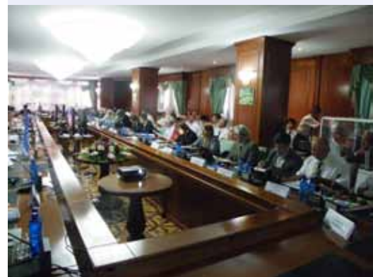
Пленарное заседание международной конференции, 28 июня, Душанбе, Таджикистан