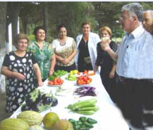
Представление изученной гермоплазмы овощей в Азербайджанском НИИ Овощеводства

новых сортов будут представлены в ГСИ в ближайшие годы. В настоящее время 23 сорта семи видов овощных культур, включая томат, сладкий и острый перец, баклажан, овощную сою, маш, спаржевую фасоль и капусту находятся в государственном сортоиспытании в Армении, Азербайджане, Казахстане, Таджикистане и Узбекистане. Эти сорта не имеют аналогов в странах ЦАК по морфологическим и хозяйственно ценным признакам. Проводится размножение семян перспективных и районированных сортов для обеспечения фермеров качественными семенами и широкого выращивания новых сортов овощных культур. Выращивание новых сортов поможет фермерам увеличить их доходы и обеспечить благополучие. Районированные сорта имеют потенциал увеличения площадей и производства, разнообразия рациона питания, увеличения экспортного потенциала свежей и переработанной продукции и увеличение доходов фермеров.