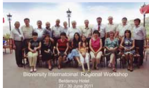
Участники регионального учебного тренинга по оценке уровня агробиоразнообразия