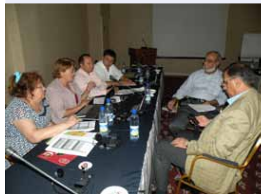
Обсуждение годового рабочего плана с казахскими партнерами