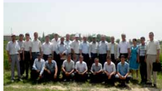
Участники Полевого дня пшеницы в Кибрае

Полевой День проекта по ресурсосберегающему сельскому хозяйству подчеркнул необходимость широкого распространения технологий посева сельскохозяйственных культур в Южных провинциях Казахстана. Региональный координатор и национальные консультанты проекта выступили с докладами по нескольким темам, в том числе о гребневом посеве озимой пшеницы и ярового ячменя, водосберегающих технологий, а также по социально-экономическим вопросам сохранения сельского хозяйства. В ходе обсуждения, региональный координатор проекта сообщил о деятельности региональной программы ИКАРДА для стран Центральной Азии и Южного Кавказа, уделяя особое внимание вопросам ресурсосберегающего сельского хозяйства, а национальные