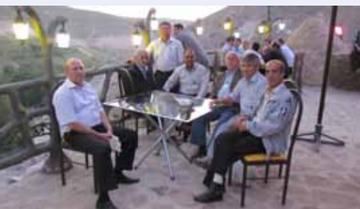
Семь участников (на переднем плане) из региона ЦАК на Первом региональном симпозиуме по озимой пшенице

Первый региональный симпозиум по озимой пшенице был совместно организован ИКАРДА-Иран, СИММИТ-Иран, а Иранским сельскохозяйственным научно-исследовательским институтом засушливых земель и проведен с 25 по 27 июня 2011 года в Тебризе, Иран. Данный симпозиум собрал более 80 ученых по озимой пшенице из 12 различных стран Центральной и Западной Азии и Северной Африки (ЦЗАСА), а также из ИКАРДА и СИММИТ для проведения обзора и оценки деятельности программ по селекции пшеницы и устойчивого производства озимой пшеницы в суровых условиях холодного климата региона ЦЗАСА. Участниками из региона ЦАК были два ученых из ИКАРДА-ЦАК, и по одному ученому из Узбекистана, Азербайджана, Грузии и Казахстан, а также два ученых из Таджикистана. Участниками из региона ЦАК были представлены страновые доклады, а также доклады о региональных совместных исследованиях по улучшению озимой пшеницы в регионе. Обсуждения проходили на тему ограничений и возможностей, региональных усилий по улучшению зимней пшеницы. Участники создали рекомендации по решению вопросов в приоритетных направлениях исследований и улучшению озимой пшеницы улучшение в регионе ЦЗАСА.