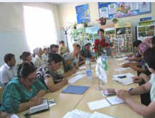
Тренинг по овощным культурам в Бостанлыке, Узбекистан