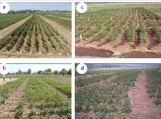
Оценка селекционированных клонов СИП на восприимчивость к засухе в Ташкенте (а), к засоленности в Сырдарье (б) и к высоким температурам в Файзабаде и Муминабаде (с, d), Таджикистан.

Климатические изменения влияют на Центральную Азию быстрее, чем во многих других частях света, при этом увеличивается давление на абиотические стрессы (наприм. жара, засуха, увеличение засоленности почвы), так же как и биотические стрессы такие как: вирусные заболевания, которые сокращают продуктивность в теплых регионах низменностей. Например, в более влажных гористых местностях южного Кавказа, заболевание фитофтороза имеет действительно критическое влияние на урожайность и прибыльность. Нехватка воды становится все более важной проблемой, ввиду высокой конкуренции водных