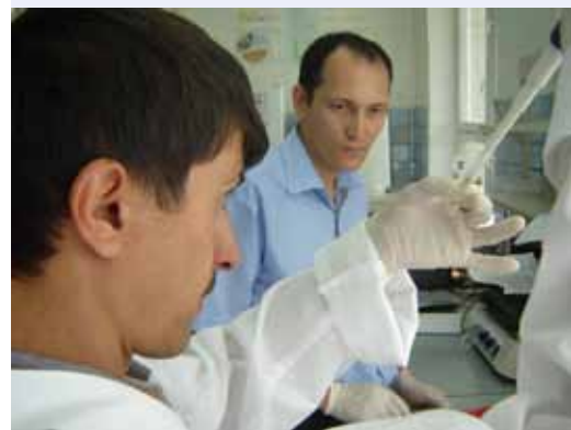
Практические занятия в лаборатории Регионального тренинг центра по молекулярным маркерам

Во время семинара участники обсудили вопросы, касающиеся расчета