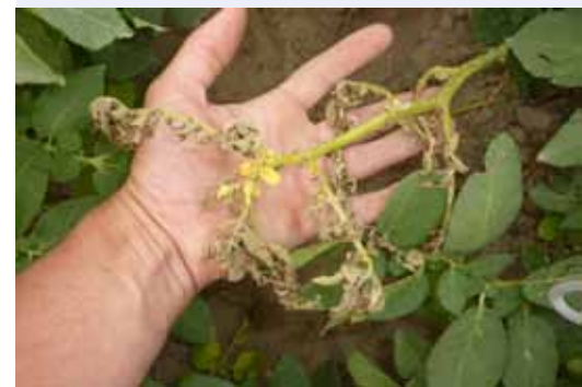
Гарм, Таджикистан: Альтернариоз ( Alternaria solani ) симптомы смешанные с фитофторозом (Июнь 2011)