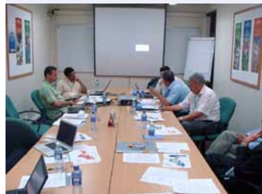
Центрально-азиатская рабочая группа

В ходе обсуждений было отмечено, что Центральная Азия в целом может быть отнесена к региону, который по большей части подпадает под определение СТИ2, т.е. имеющий наиболее уязвимые и стремительно деградирующие агроэкосистемы с некоторыми участками, которые могут рассматриваться в рамках СТИ3 (т.е. имеющие потенциал для устойчивой интенсификации сельскохозяйственной продуктивности). Были выбраны следующие участки: Арал-Туркестанская Низменность бассейна Аральского моря, включая Северо-Запад Туркменистана, Запад Узбекистана, и Юго-Запад Казахстана в качестве наиболее подходящего демонстрационного участка в рамках СТИ2, представляющего типичные орошаемые районы в низовье рек, подверженные высокому уровню засоления почв и дефициту воды, с серьезной утратой агробиоразнообразия и продуктивности. В связи с тем, что ландшафт Центральной