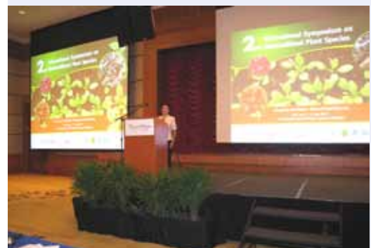
Выступление д-ра Равзы Мавляновой