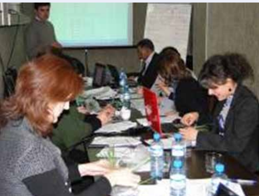
Участники определяют параметры рассады пшеница во время тренинга

Учебный семинар «Управление генетическими ресурсами растений (ГРР) и определение параметров гермплазмы» для Кавказского региона проведен в г.Тбилиси с 4 по 9 апреля 2011 года. Данный учебный семинар был организован и поддержан Региональным офисом ИКАРДА по Центральной Азии и Кавказу.