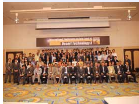
Участники Международной конференции по исследованиям на засушливых землях, Токио, Япония

Основным результатом работы выставки стали встречи руководителей отечественных научных институтов, предприятий и организаций с потенциальными партнерами, в ходе которых были определены сферы взаимных интересов и направления возможного сотрудничества. Принимая во внимание стратегическую важность сбора, сохранения, изучения