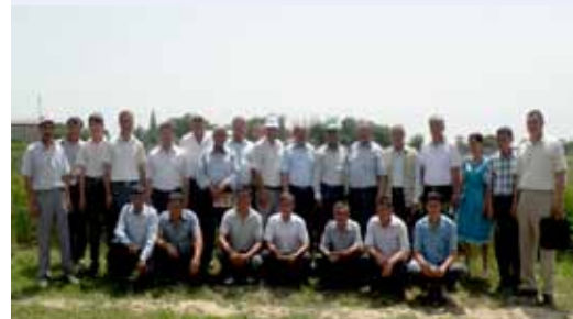
Участники Полевого дня пшеницы в Кибрае

Полевой День проекта по ресурсосберегающему сельскому хозяйству подчеркнул необходимость широкого распространения технологий посева сельскохозяйственных культур в Южных провинциях Казахстана. Региональный координатор и национальные консультанты проекта выступили с докладами по нескольким темам, в том числе о гребневом посеве озимой пшеницы и ярового ячменя, водосберегающих технологий, а также по социально-экономическим вопросам сохранения сельского хозяйства. В ходе обсуждения, региональный координатор проекта сообщил о деятельности региональной программы ИКАРДА для стран Центральной Азии и Южного Кавказа, уделяя особое внимание вопросам ресурсосберегающего сельского хозяйства, а национальные