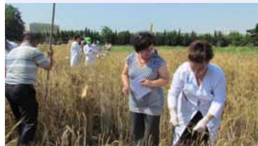
Сбор данных участниками тренинга на экспериментальных участках пшеницы