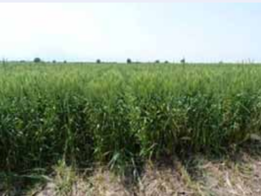
Озимая пшеница посаженная на грядках

Опыт проекта Улучшение продуктивности воды (УПВ) показывает, что улучшение управления водными ресурсами может значительно способствовать увеличению производства сельскохозяйственной продукции, росту доходов фермеров, экономии воды и сокращению водных конфликтов. В частности, фермеры могут получать эту пользу, если группы водопользователей (ГВП) и Ассоциаций водопользователей (АВП) способны ввести в действие оплату за воду на основе потребляемого объема. Распределение воды на основе объема подразумевает наличие водоизмерительных сооружений для контроля объема воды, подаваемой индивидуальным фермерам. Сегодня большинство АВП не имеют таких сооружений, и даже если они есть в АВП, их мало и они находятся в полуразрушенном состоянии. Следовательно, существует необходимость строительства или реконструкции таких сооружений. Правильное измерение расхода воды и учета подачи воды имеет важное значение для обеспечения прозрачности в управлении водой. По этим причинам, Швейцарское агентство по развитию и сотрудничеству решило поддержать строительство водомерных сооружений. Восемь АВП в Ферганской долине были полностью оборудованы водомерными сооружениями в рамках этого проекта.