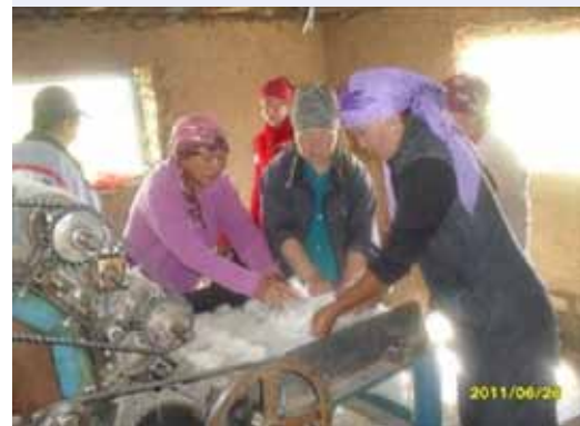
Обучение работе на шерсте-чесальной машине в селе Лахол

Реализация вышеупомянутого совместного проекта ИФАД-ИКАРДА