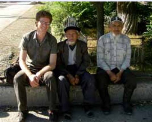
Доминик с аксакалами (старейшинами) в Кулунду, Кыргызстан

проводить больше таких семинаров. Результаты исследования включают в себя: