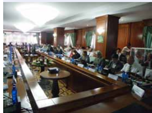
Пленарное заседание международной конференции, 28 июня, Душанбе, Таджикистан