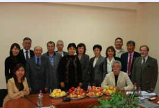
Участники 6-го Совещания Национального Руководящего Комитета

С 1991 года было проведено девять Конференций по Пустынным Технологиям. Главным образом они были направлены на природные особенности пустынь (таких как климат, гидрологию и растительность), засушливых земель, усиления процесса опустынивания и методы предотвращения процесса опустынивания, разработки и передачу технологий для восстановления и сохранения засушливых