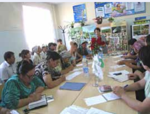
Тренинг по овощным культурам в Бостанлыке, Узбекистан