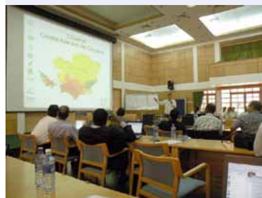
Представление пилотных районов в Центральной Азии