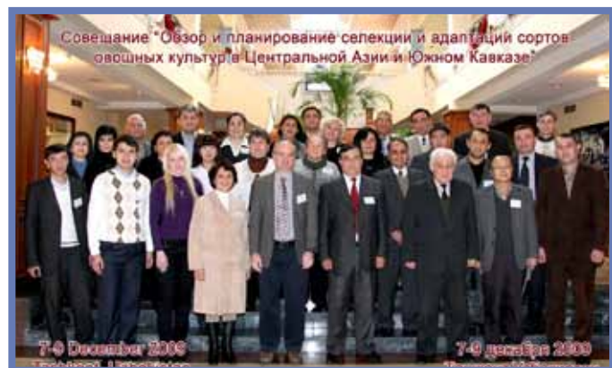
Участники семинара “Обзор и планирование селекции и адаптации сортов овощных культур в Центральной Азии и Южном Кавказе”

Обзор сортоиспытаний в каждой стране региона ЦАК был представлен в презентациях специалистов из институтов-партнёров. В период 2005-2009 гг. АЦИРО предоставил новую коллекцию, включающую 1300 образцов гермплазмы 15 –ти видов овощных культур. В настоящее время во всех странах отмечаются достижения по сортоиспытаниям. В результате, пятьдесят линий десяти видов овощных культур, выделенных в прошлые годы в восьми странах ЦАК, в 2009 году испытывались в конкурсных сортоиспытаниях.