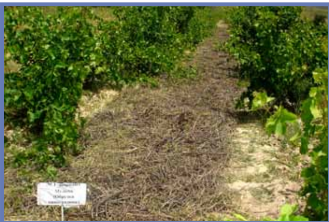
Нарезки виноградной лозы на террасах Таджикистана как способ защиты почвы и сбережения почвенной влаги

Лазерная планировка земель, орошение с применением пластиковых лотков и совмещенное использование оросительных и дренажных вод были протестированы и применены, повысив продуктивность использования воды на 15-25% в Кыргызстане, Туркменистане и Узбекистане. Система гребневого посева помогла улучшить уровень прорастания семян, сократила вдвое норму расхода семян (пшеница и рис), сократила объем используемой воды для орошения на 10% и позволила диверсифицировать систему севооборота в Казахстане, Кыргызстане и Узбекистане. Совмещенный посев хлопчатника и бобовых, кукурузы и бобовых, или бобовых и ячменя дал высокие показатели урожайности в Кыргызстане, Таджикистане и Узбекистане. Также посев в стерню или с применением мульчи были успешно протестированы в горных районах Кыргызстана