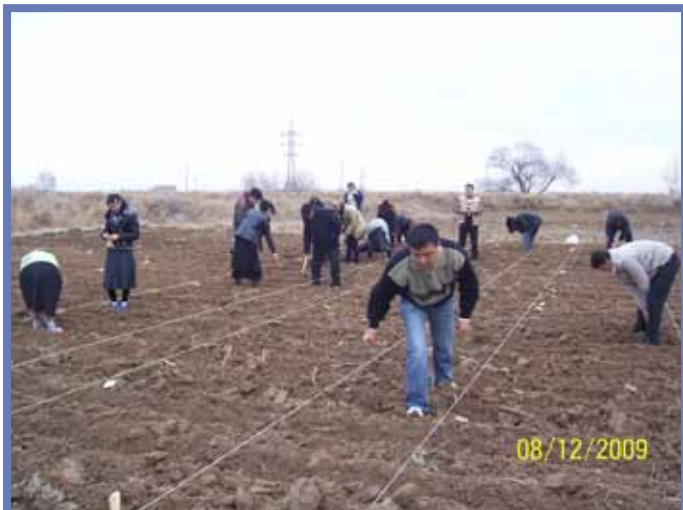
Посев. Кашкадарьинский НИИ

ИКАРДА, Алеппо и Международной Программы по улучшению озимой пшеницы, Турция, которые были распространены партнерами НССХИ в различных странах ЦАК. Посеянные экспериментальные сорта успешно всошли и уже весной 2010 года смогут быть оценены. Эти питомники являются основными источниками для улучшения гермплазмы пшеницы, ячменя, нута, чечевицы, фасоли и зеленого горошка в регионе ЦАК.