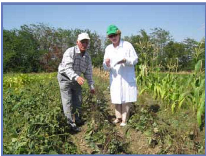
Апробация сорта маша Дурдона

В 2010 году новый сорт маша Дурдона, созданный в Узбекском НИИ растениеводства в сотрудничестве с АЦИРО – Всемирным Центром Овощеводства был признан перспективным для районирования Государственной комиссией по сортоиспытанию сельскохозяйственных культур Узбекистана.