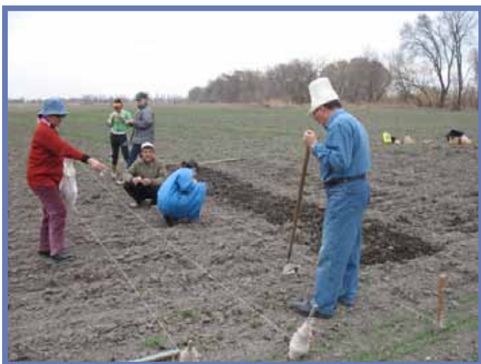
Экспериментальный участок в Иссык-кульской области, Киргизстан, где студенты проводят опыты по посадке картофеля

Прошедшее в Баку совещание было направлено на то, чтобы обратить особое внимание стран региона на существующие угрозы, вызванные ржавчиной пшеницы и возможность распространения Ug99. Участниками, прибывшими из стран ЦАК и экспертами ФАО и ИКАРДА были обсуждены и