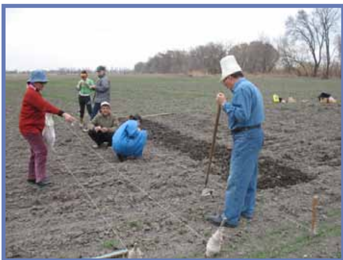
Экспериментальный участок в Иссык-кульской области, Кыргызстан, где студенты проводят опыты по посадке картофеля

Прошедшее в Баку совещание было направлено на то, чтобы обратить особое внимание стран региона на существующие угрозы, вызванные ржавчиной пшеницы и возможность распространения Ug99. Участниками, прибывшими из стран ЦАК и экспертами ФАО и ИКАРДА были обсуждены и