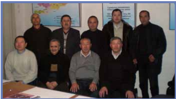
Участники встречи в Ферганской долине

комплексным и многофакторным процессом. Они также обозначили актуальность вопросов и тематик, предоставляемых фермерам, отличающиеся своей своевременностью, сезонностью и необходимостью.