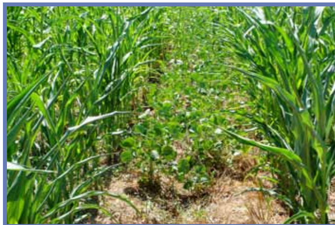
Совместный посев кукурузы и бобовых помог увеличить доход фермеров и укрепить продовольственную безопасность

Проект «Устойчивое управление земельными