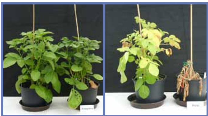
СИП-Лима: Засухоустойчивые сорта в питомниках. Некоторые картофельные клоны, такие как Agapuaima , имеют потенциал восстановления после длительного стресса из-за отсутствия воды (слева) по сравнению с восприимчивыми клонами (справа)

нехватки воды. Самые важные из них: улучшенная эффективность использования воды, улучшенный рост корневища в условиях засухи, рост потенциала регенерации после увядания и более высокий индекс урожайности. Физиологическая база этих условностей состоит из сбалансированного контроля устойчивой активности, осмотического приспособления в виде накопления влаги в клетках растения, влияющего на более низкий осмотический потенциал и созданный тургор в условиях водного стресса. С помощью этих опытов были определены гены-кандидаты. Опыты, проведенные в СЗЦА, подтвердили эти гипотезы.