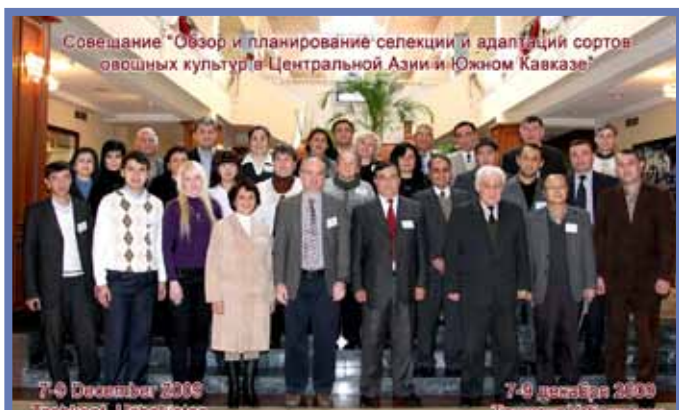
Участники семинара “Обзор и планирование селекции и адаптации сортов овощных культур в Центральной Азии и Южном Кавказе”

Обзор сортоиспытаний в каждой стране региона ЦАК был представлен в презентациях специалистов из институтов-партнёров. В период 2005-2009 гг. АЦИРО предоставил новую коллекцию, включающую 1300 образцов гермплазмы 15 –ти видов овощных культур. В настоящее время во всех странах отмечаются достижения по сортоиспытаниям. В результате, пятьдесят линий десяти видов овощных культур, выделенных в прошлые годы в восьми странах ЦАК, в 2009 году испытывались в конкурсных сортоиспытаниях.