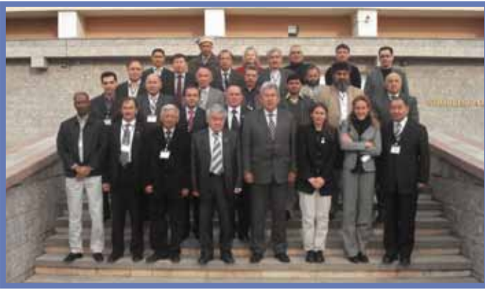
Участники заключительного регионального семинара проекта «Совместные действия общин в области интегрированного и рыночно-ориентированного животноводства и кормопроизводства в Центральной и Южной Азии»