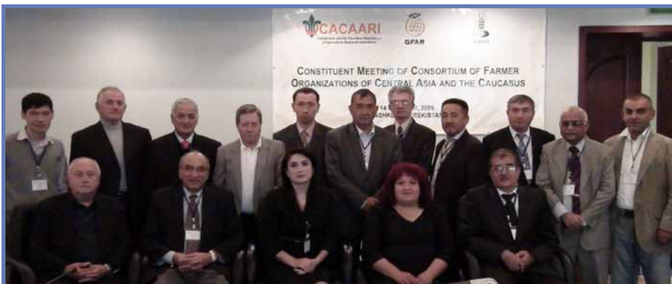
Участники Региональной консультативной встречи