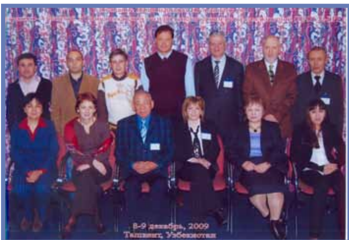
Участники совещание национальных координаторов по ЦАТКС-ГРП

обновленная информация по разработке национальных стратегий по ГРП, потребности, приоритеты и планы на будущее и т.д.);