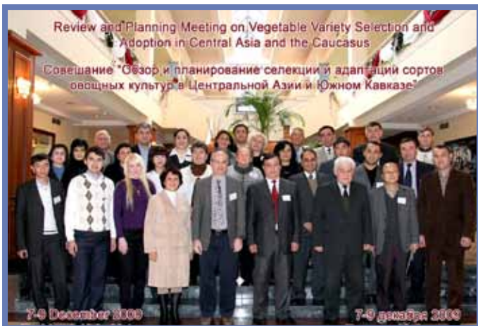
Участники совещания Руководящего Комитета Сети по исследованиям и развитию овощеводства в Центральной Азии и Южном Кавказе

в странах ЦАК, посредством развития устойчивого овощеводства и рыночной системы через наращивание потенциала общественного и частного секторов и взаимного сотрудничества.