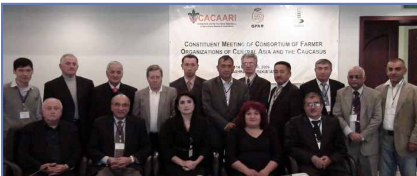
Участники Региональной консультативной встречи