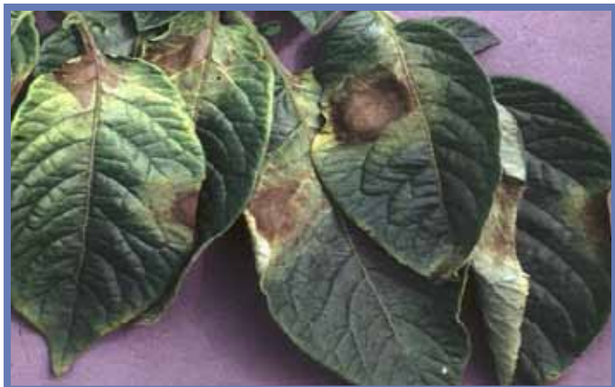
Фитофтора ( Phytophthora infestans ). Поражение листьев

виды-колонисты, оба они являются переносчиками вируса картофеля, так как чрезвычайно прожорливы. (Foster et al., 1997; Kennedy и др., 1962; van Hoof, 1980). Из за того что картофельные растения, пораженные вирусом не могут быть вылечены, как в случае с грибом, стратегия контроля заболеваний должна быть сфокусирована на превентивных мерах, таких как выбор изолированных участков, использование устойчивых сортов, контроль над насекомыми – переносчиками и семенами, с применением всех компонентов так называемой «Интегрированной защиты от заболеваний». Фермеры, выращивающие картофель часто покупают семена, собранные на высокогорных районах или на изолированных участках, которые относительно свободны от атаки вирусов и насекомых. Но малоимущие фермеры, зачастую не могут приобрести такие семена. Западные компании, экспортирующие семена в развивающиеся страны не проводят селекционные работы по получению устойчивых сортов, так как это очень дорого. Опыт показывает, что компании торгующие семенами не хотят обеспечивать фермеров в развивающихся странах устойчивыми к вирусам сортами.