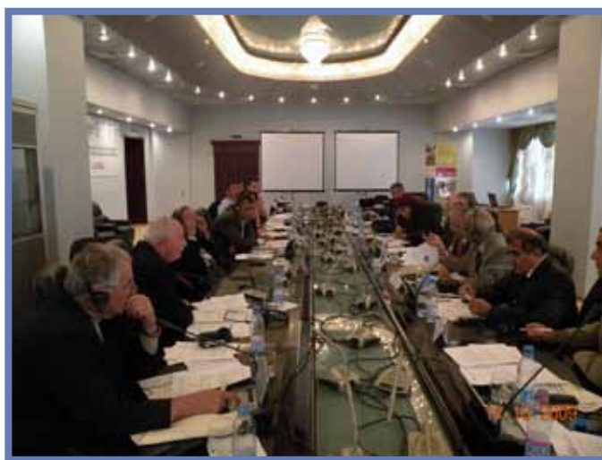
Встреча Консорциума неправительственных сельскохозяйственных организаций Центральной Азии и Южного Кавказа

Учредительные встречи Консорциума неправительственных сельскохозяйственных организаций Центральной Азии и Южного Кавказа (КНПО-ЦАК) и Консорциума фермерских организаций Центральной Азии и Южного Кавказа (КФО-ЦАК) при Ассоциации сельскохозяйственных научно-исследовательских организаций Центральной Азии и Южного Кавказа (АСНИОЦАК) были проведены 14 и 15 октября 2009 года в Бизнес центре «Пойтахт» в Ташкенте, Республике Узбекистан. На каждой из встреч участвовало около 20 человек. Целью встреч был сбор представителей широкого круга организаций, имеющих отношение к сельскому хозяйству для обсуждения