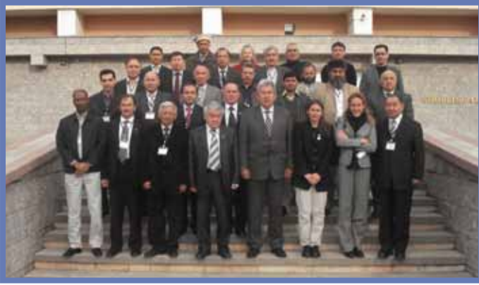
Участники заключительного регионального семинара проекта «Совместные действия общин в области интегрированного и рыночно-ориентированного животноводства и кормопроизводства в Центральной и Южной Азии»