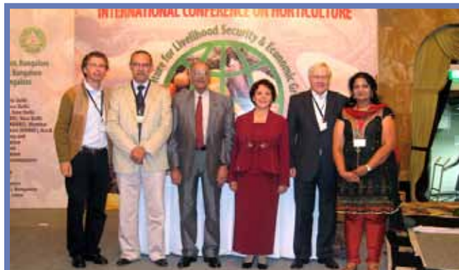
Члены Руководящего комитета Международной Сети по Овощеводству