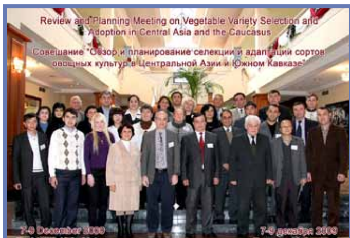
Участники совещания Руководящего Комитета Сети по исследованиям и развитию овощеводства в Центральной Азии и Южном Кавказе