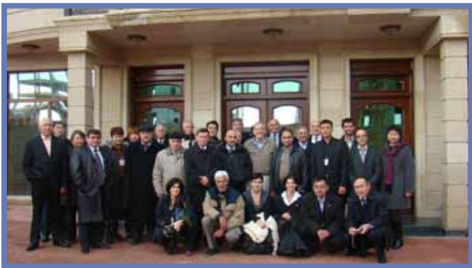
Участники «Регионального информационного совещания о ржавчине пшеницы в Центральной Азии и Южном Кавказе»

определены региональные и национальные планы относительно существующих проблем.