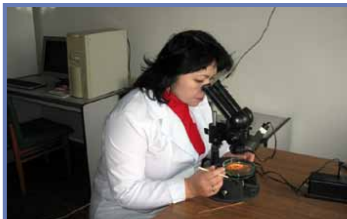
Просмотр развития хищных клещей - амблисейусов на искусственной питательной среде под микроскопом

Так как амблисейусы ( A. mckenziei , A. cucumeris , A. swirskii ) являются олигофагами, они с успехом разводятся с применением мучного клеща ( Asarus farris (Oud.)) в узбекском НИИ защиты растений. Способ массового разведения амблисейусов состоит в следующем: разведение хищного клеща и его жертвы мучного клеща проводят в содержащем влажные отруби пластиковом контейнере (2- л, высота 25 см), или в 3 литровой стеклянной банке, которую помещают в более большой контейнер или ванну, где уровень воды не должен превышать \frac{1}{4} объема. Оба контейнера покрывают целлофановой пленкой