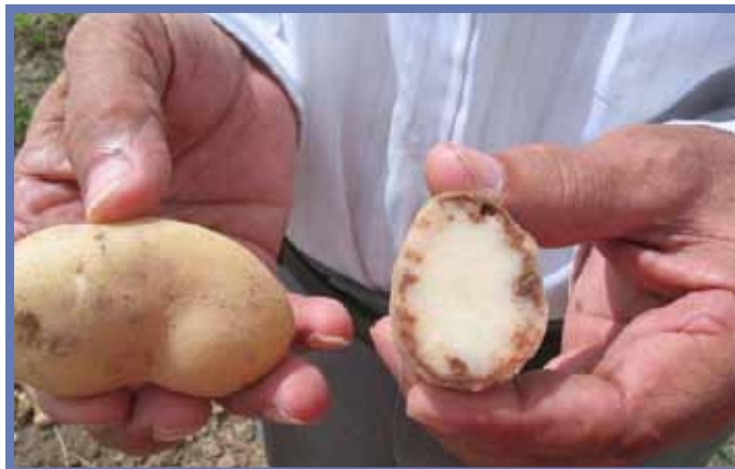
Фитофтороз по клубням ( Phytophthora infestans ). Поражение клубней. Май, 2010, Ташкент

Как показало исследование, проведенное СИП в сентябре 2009 года случаи заболевания картофеля