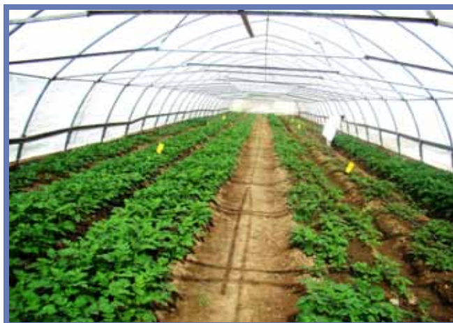
Размноженные клоны, предоставленные проектом ГТЦ в условиях теплиц Национального Университета Узбекистана

Проект, спонсируемый БМЦ/ГТЦ, был начат в январе 2008 г. и имеет продолжительность - три года. Фундаментальные исследования проводятся в головном офисе СИП, Лима, Перу, являющийся центром