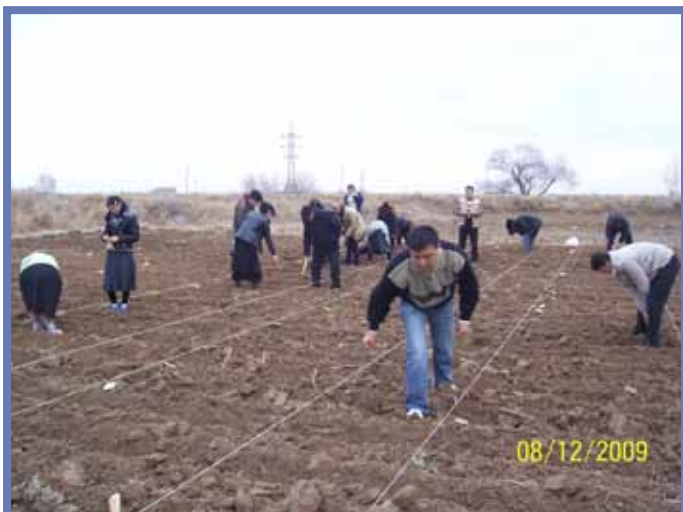
Посев. Кашкадарьинский НИИ

ИКАРДА, Алеппо и Международной Программы по улучшению озимой пшеницы, Турция, которые были распространены партнерами НССХИ в различных странах ЦАК. Посеянные экспериментальные сорта успешно всошли и уже весной 2010 года смогут быть оценены. Эти питомники являются основными источниками для улучшения гермплазмы пшеницы, ячменя, нута, чечевицы, фасоли и зеленого горошка в регионе ЦАК.