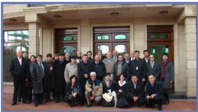
Участники «Регионального информационного совещания о ржавчине пшеницы в Центральной Азии и Южном Кавказе»

определены региональные и национальные планы относительно существующих проблем.