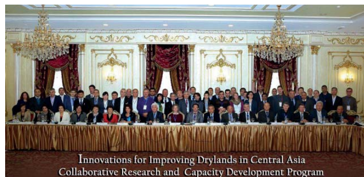
Innovations for Improving Drylands in Central Asia Collaborative Research and Capacity Development Program